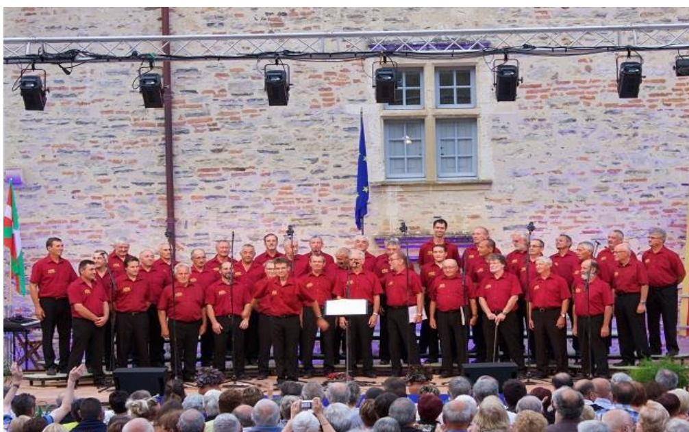
Les Gaouyous à l'abbaye d'Artous - 11 juillet 2015 Cloture du XIII ème Festival International de Chant Choral